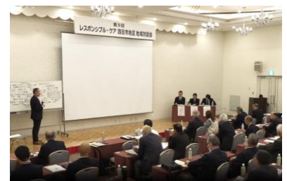
＜ 質疑応答 ＞