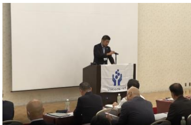
＜ 四日市市長あいさつ ＞

昨年の 2024 年 10 月にはプラトンホテル四日市にて、第 9 回レスポンシブル・ケア四日市地区地域対話会を開催しました。地域自治会関係、行政関係より約 70 名の皆様にご参加を頂き、参加人数約 150 名の地域対話会となりました。2026 年 10 月には第 10 回レスポンシブル・ケア四日市地区地域対話の開催を予定しており、加盟会社で準備を進めています。