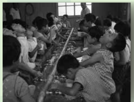
在盐滨小学漱口的小学生