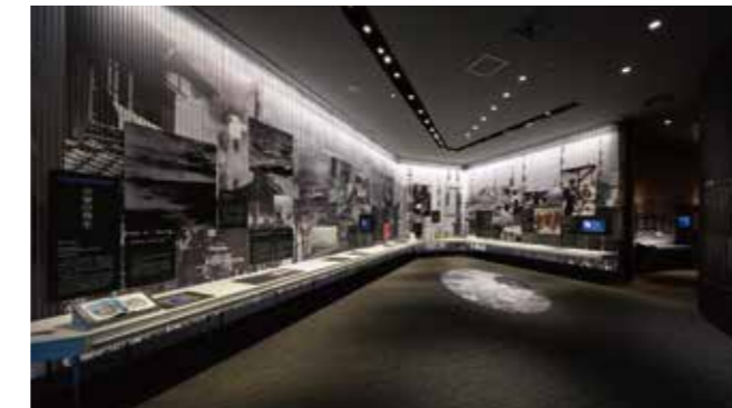
2 “公害的发生” 战后，大气污染成为了日本全国性问题……工业城市四日市也出现了大量的怨言和严重的健康问题……当时的照片和珍贵的音源传达出了公害的历史与受害的严重性。