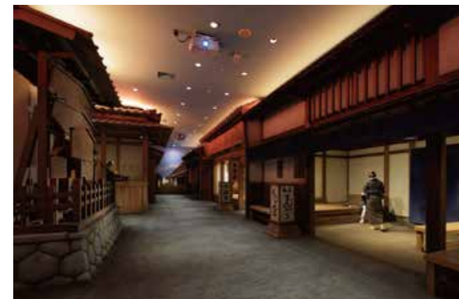
4 [近世] 四日市驿站

在此“时空街道”，让您尽情纵横时间与空间，体验和感受历史，而以原来尺寸再现了弥生时代的竖穴住宅，室町时代四日的市场，江户时代的四日市驿站。