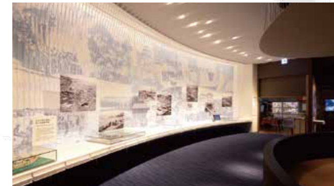
1 “产业的发展与生活的变化” 通过当时的照片和生活场景的再现，可以了解四日市市历经近代以来的港口发展、战争，最终建设联合工厂的情形。