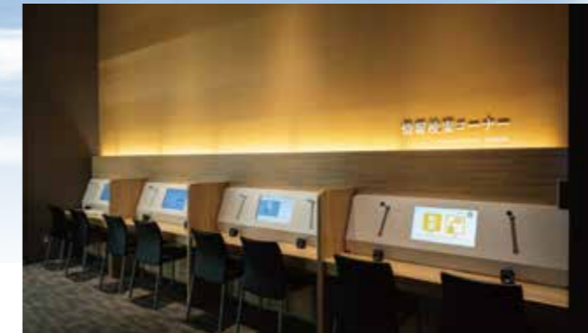
“信息检索处” 可以浏览相关人员的采访证词影像，检索本馆收藏的资料目录。