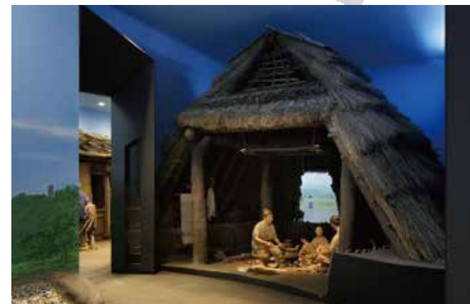
2 [古代] 久留信的村庄（竖穴住宅）