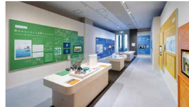
5 “四日市的现在与未来” 介绍了环境问题的现状和举措。在挑战谜题和游戏的同时，思考我们能改善未来环境做些什么吧。