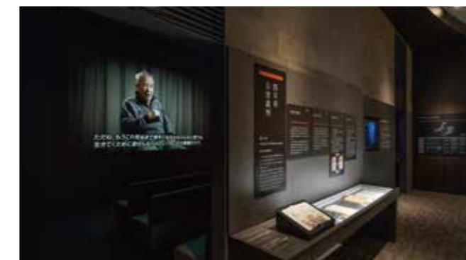
“四日市公害裁判场馆” 1967年，矶津的公害认定患者起诉了联合工厂企业。通过当时的资料和证词交织而成的影像，讲解四日市公害裁判及其影响。