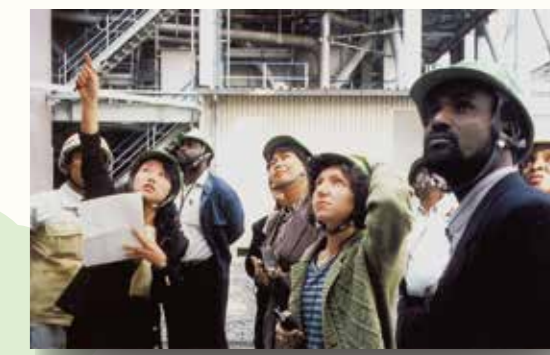
ICETT的日本国内接待培训

为了将更加美好的环境传承给未来，希望您能在本馆学到知识，并将其应用到家庭、地区的环境活动中。