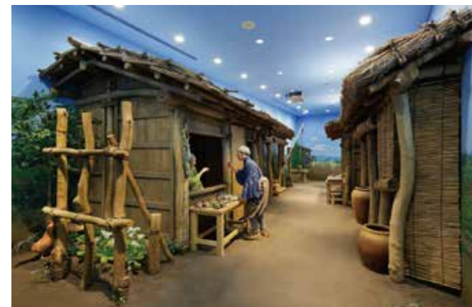
3 [中世] 四日的市场