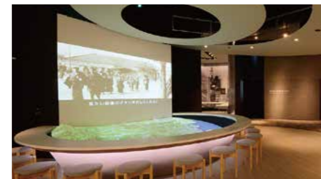
3 “城市规划的变迁” 通过投影四日市市的模型与影像，讲解1889年诞生的四日市町变化至今的过程。