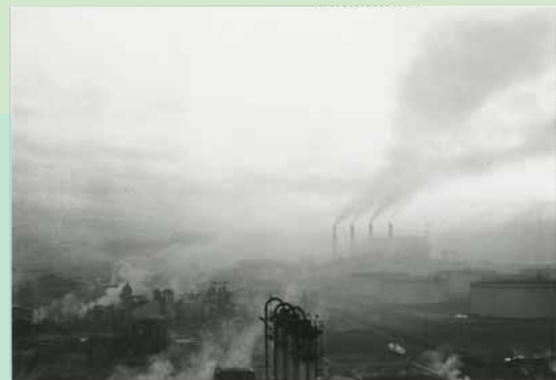
昭和30年代中期（1960年左右）的联合企业体