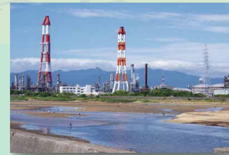
如今的联合企业体