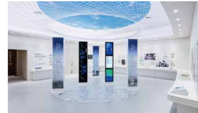
4 “环境改善的措施” 介绍了市民、企业和行政部门团结一致、改善环境的举措及成果、国际贡献。

在这里可以通过与四日市公害相关的资料和影像，学习环境与企业以及人们生活的关系，感受环境的重要性，并引发对未来环境的思考。