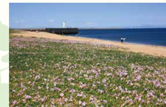
吉崎海滩的打碗花