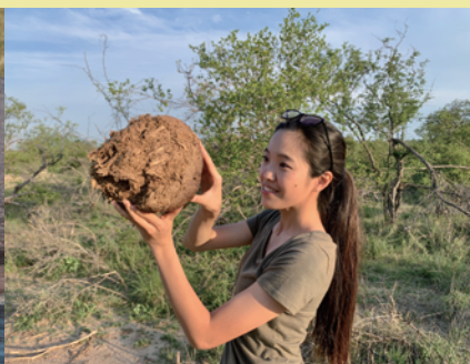
←写真左から「サイの角処置保護活動のようす」「水場に入るカバ」、「ゾウのうんち」