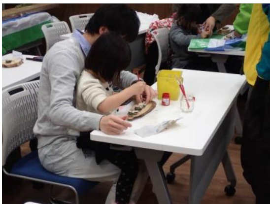
(竹で工作し、竹林をきれいに！)

同フェアでは、グリーンカーテンフォトコンテスト表彰式、四日市市環境活動賞表彰式、公害・環境に関する研究発表会・表彰式をあわせて開催しました。(来場者数：978人)