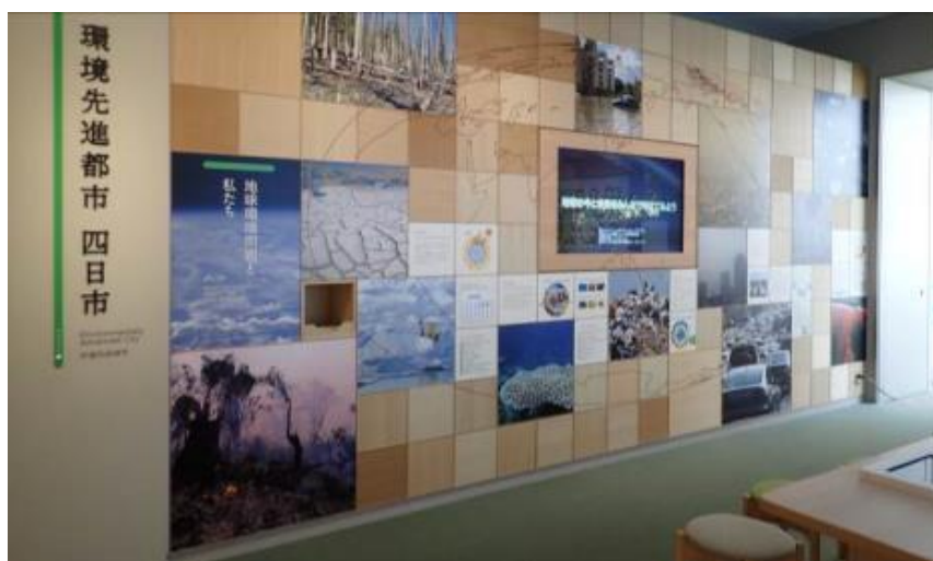
映像装置を大型化し、地球温暖化の状況についての映像を上映する「環境先進都市四日市」コーナー