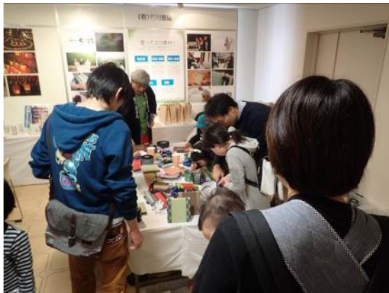
(環境フェア：工作ブース)