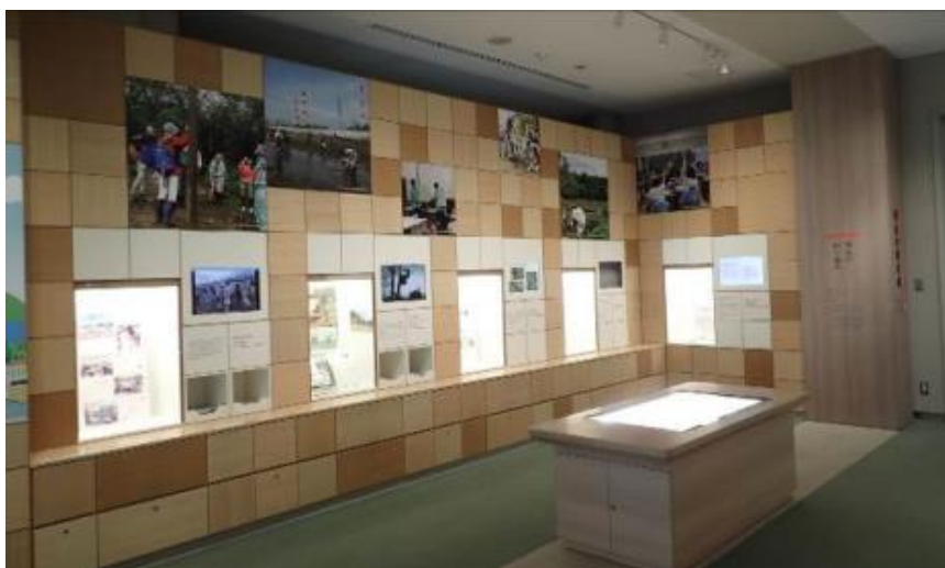
壁面上部に市民・環境活動団体や企業等の環境保全活動紹介パネルを追加した「現在の四日市」コーナー

また、団体来館者用のガイドンス映像については、日本語に加え英語、中国語の吹き替え版を製作し、海外からの見学時に活用した。