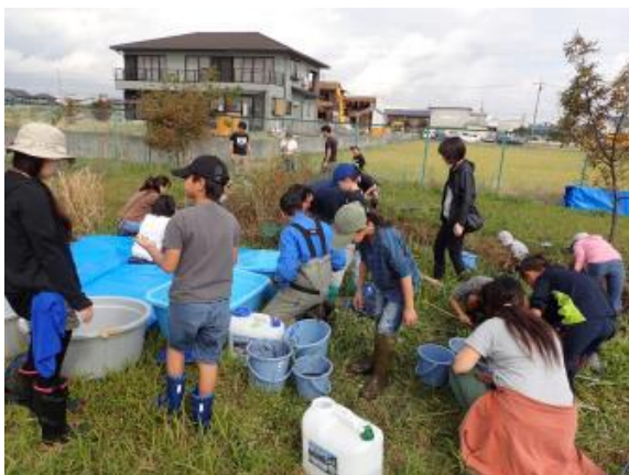
エコパートナー講座 「池の生き物救出大作戦」