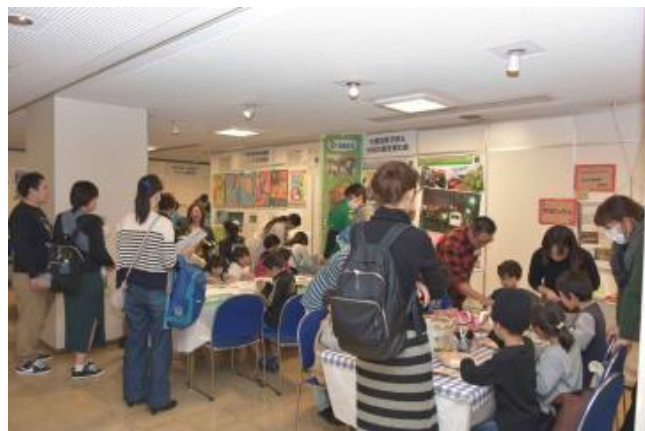
「環境フェア」の様子