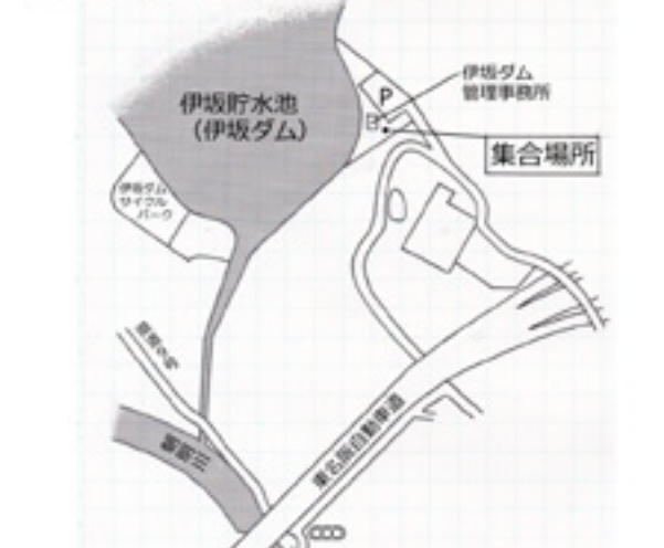
伊坂ダム管理事務所前