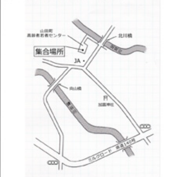
山田町高齢者若者センター駐車場