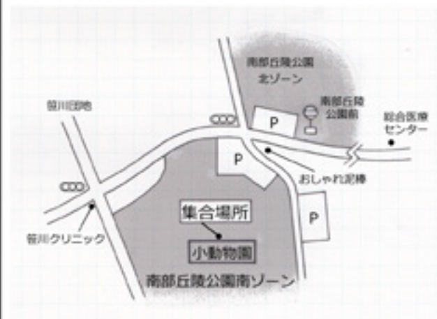
南部丘陵公園南ゾーン 小動物園北側広場