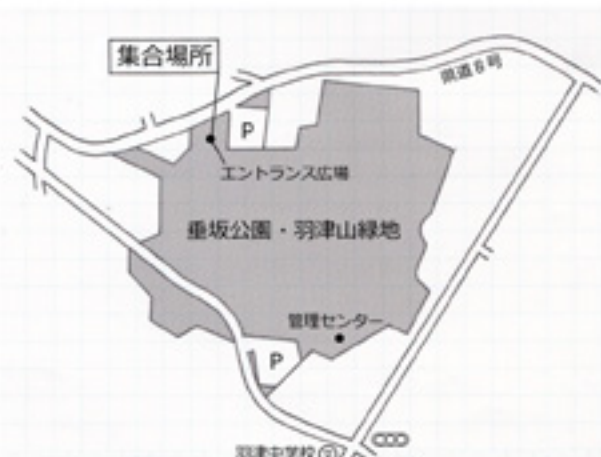
垂坂・羽津山緑地 エントランス広場