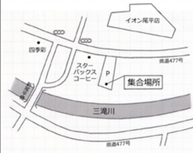
イオン尾平店駐車場 スターバックスコーヒー東側