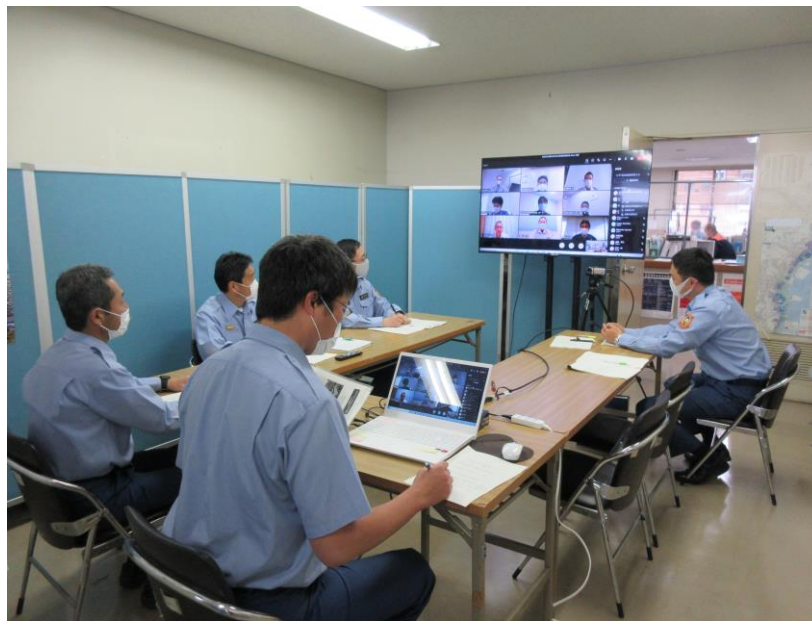
コンビナート事業所とリモート会議にて実施する消防連絡会

※ 四日市コンビナート消防連絡会とは、消防本部とコンビナート事業所の定期的な意見交換の場として、平成19年1月よりコンビナート事業所の自主保安体制の強化と危険物行政の効果的・効率的な運用を目的とし設置している。