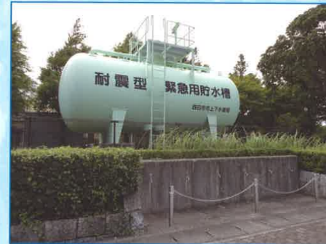
【緊急用貯水槽（地上式）】 こちらは、地上式の緊急用貯水槽です。

四日市市上下水道局では、地震などの災害により水道がでなくなった場合に備えて、市民のみなさんに飲料水を供給する『緊急用貯水槽』などの施設を整備しています。もしもの時のために、前もってお近くの応急給水拠点を確認しておきましょう！