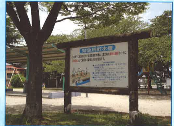
【緊急用貯水槽（地下式）】 この看板の地下に緊急用貯水槽があります。