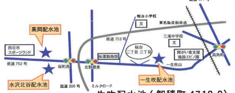
一生吹配水池（智積町 4712-2）