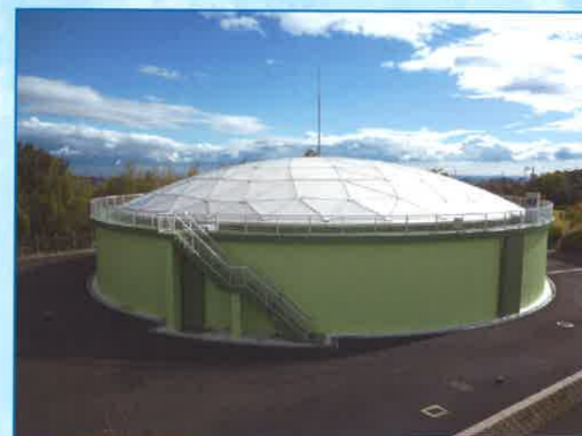
【配水池（緊急遮断弁付）】 災害時には飲料水を供給する設備があります。