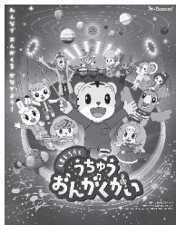
制作/D&Dピクチャーズ 著作/ベネッセコーポレーション ©Benesse Corporation 1988-2025/しまじろう

※プラネタリウム内は通常より明るくしています。 ※幼児対象の番組のため、大人のみでの観覧はご遠慮ください。