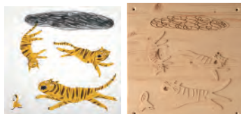
2点とも:アンドレア・アンティノリ(イタリア)「大いなる戦い」

特別展示『「見る」を超えて』に実際に触れてみませんか。簡単な作品解説もあります。 講師:当館職員 場所:4階特別展示室 参加費:無料(当日の観覧券が必要です)