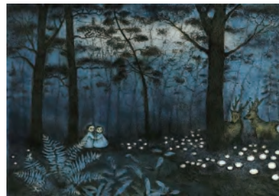
つじ にめき(日本)「アボンとヤボネ。まじよのはじまりのはなし」

チケットの半券で、近鉄百貨店四日市店9階・10階レストラン街(一部除く)、都ホテル四日市、ふれあいモールアサヒピアギャラリー、酒翠庵(茶室)での朝刊やドリンクサービス等があります。