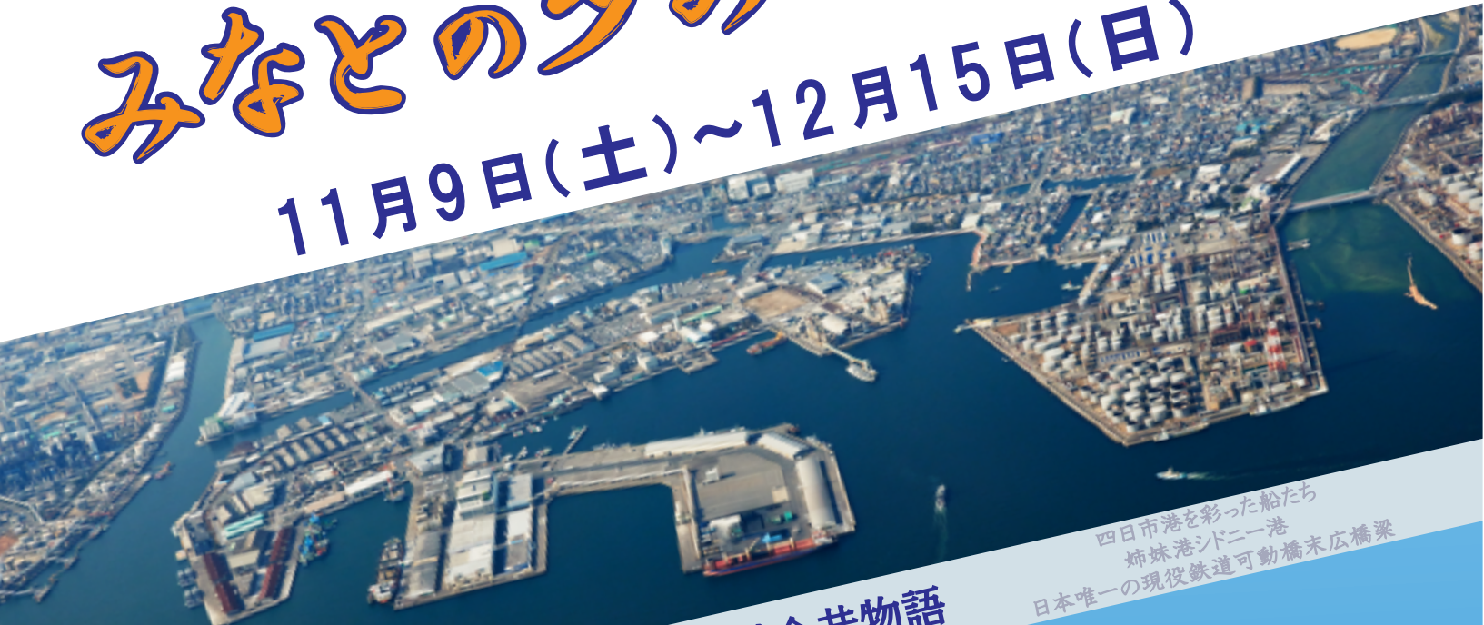
四日市港を彩った船たち 姉妹港シドニー港 日本唯一の現役鉄道可動橋末広橋梁