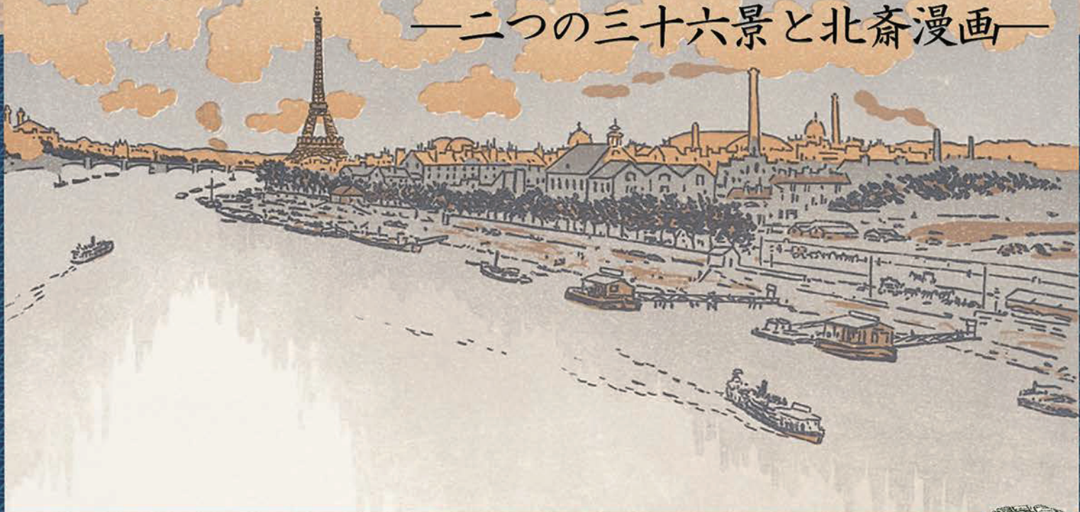
『エッフェル塔三十六景』<ポワン・デュ・ジュール門より>