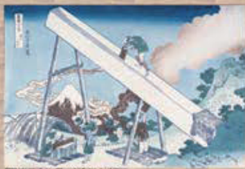
「富嶽三十六景」<遠江山中>