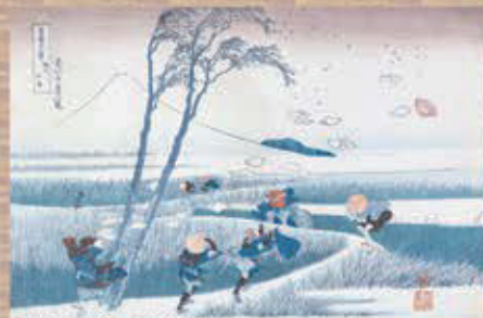
「富嶽三十六景」<駿州江尻>