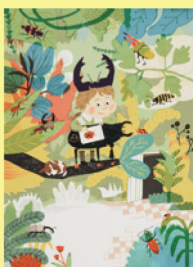
「どんなに有名になっても、やっぱりひとりで虫の絵をかくのが好き。」 LING-HSING HUANG