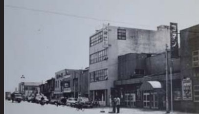
ロマン座(東四ツ谷町)