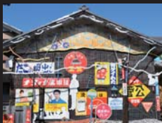
協力：珙瑯看板研究所

後援：中日新聞社、朝日新聞社、毎日新聞社、読売新聞中部支社、伊勢新聞社、三重エフエム放送、三重テレビ放送、NHK津放送局、(株)シー・ティー・ワイ CTY-FM