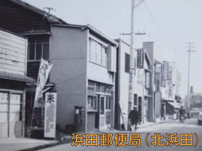
浜田郵便局(北浜田)