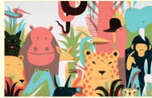
ジュアン・ネグレスコロル(スペイン)「動物たちの町」