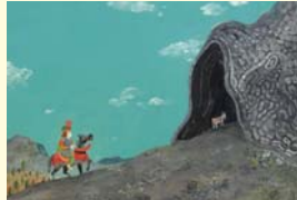
特別展示1 マヌエル・マルソル(スペイン)「ドン・フェルミンの伝説」

また特別展示では、昨年第8回ポーロニヤSM出版賞を受賞したスペインのイラストレーター、マヌエル・マルソルの受賞記念絵本「ドン・フェルミンの伝説」の原画約20点を紹介します。さらに昨年入選者で、今年のブックフェア会場のパネルやサインに採用された、クロエ・アルメラの原画13点とその絵を使ったアニメーションもご覧いただけます。