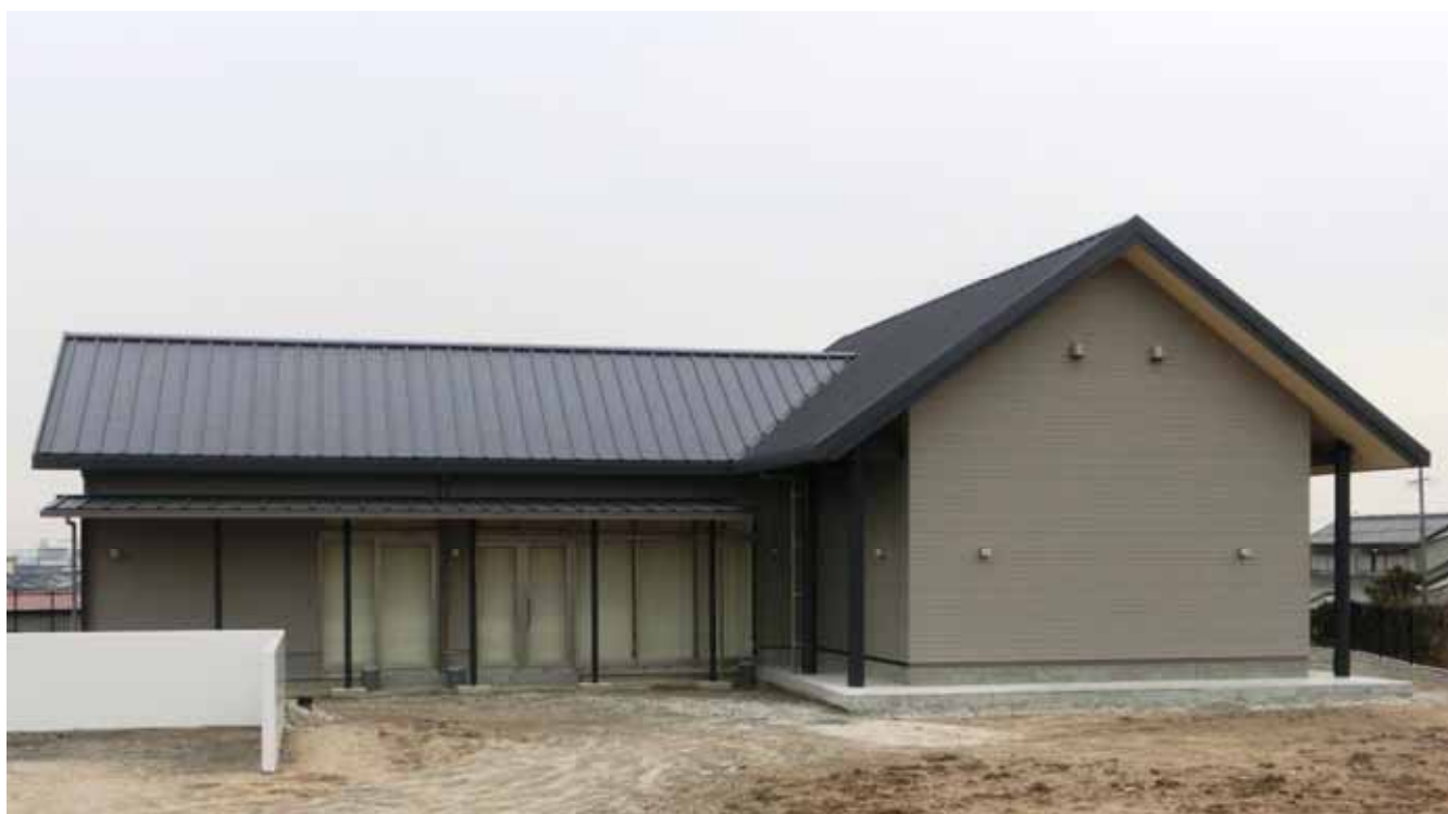
建設が終わったガイダンス施設(正面:北西から)