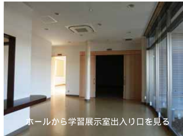
ホールから学習展示室出入口を見る