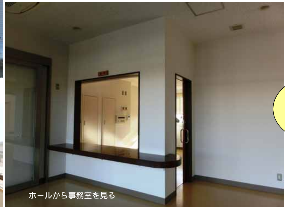
ホールから事務室を見る