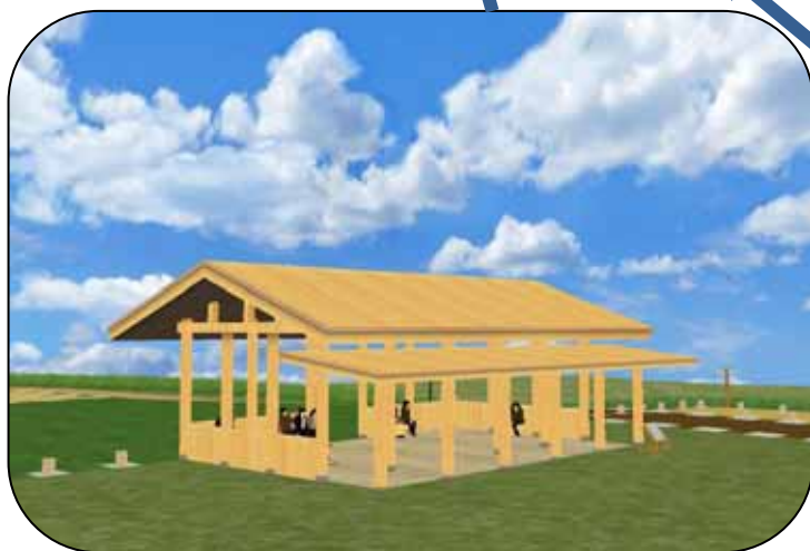
正殿の立体表示(イメージ)