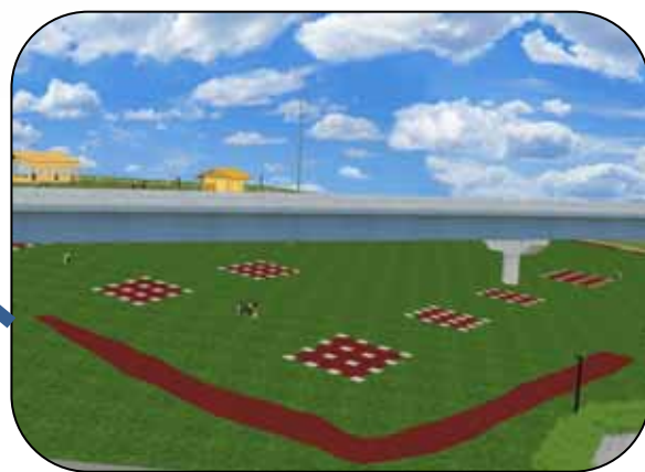
正倉院の平面表示