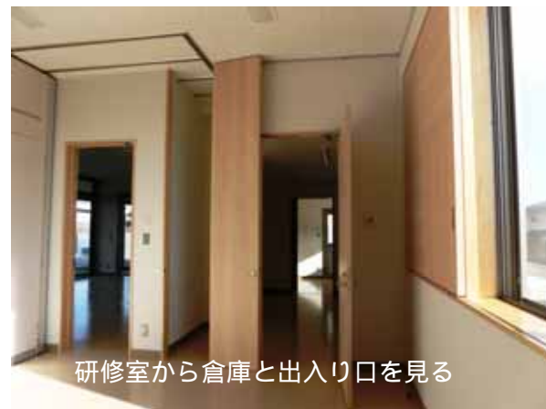
研修室から倉庫と出入口を見る