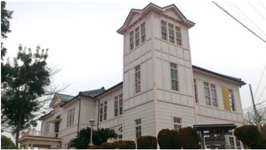
▶外壁はほぼ更新となり復元される

また、建物の裏にあたる北西側にポンプ付きの防火水槽を据え置きし、万一の場合に備える。