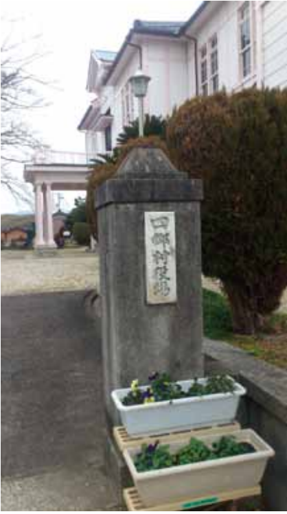
▲旧四郷村役場 (四郷郷土資料館)

四日市市教育委員会は、西日野町に所在する四日市市指定有形文化財(建造物)「旧四日市市役所四郷出張所(四郷村役場)」の耐震補強を主目的とする修理工事に、来月にも着手する。工事期間は、二年後の令和五年(二〇二二)一月までを見込む。 Ⅱ 関連②③④面