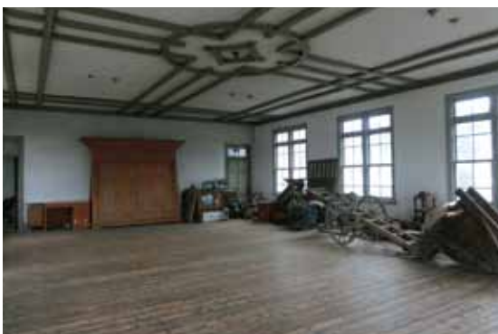
▶この床を剥がして、また戻す