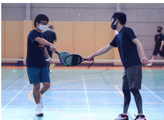
タッチもソーシャルディスタンスで