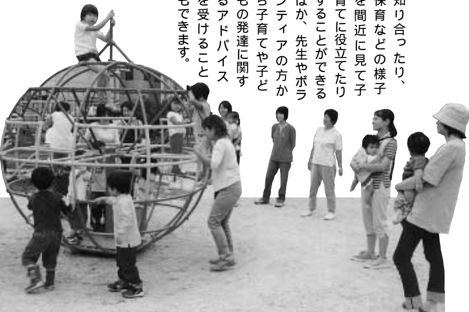
園のスタッフやお母さんたちと一緒に遊ぶ子どもたち(四日市幼稚園)

ます。園開放は「あそぼう会」などと呼ばれ、週一回ほど行われており、子育て中の親子はだれでも気軽に参加できます。子どもは安全な園内で園児と一緒に遊んだり、先生やボランティアのみなさんによる本の読み聞かせやゲームなどを楽しむことができます。親はほかの保護者と