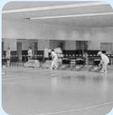
ランニングトラックとフィールド