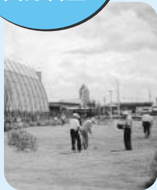
グラウンドゴルフ場