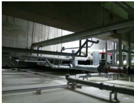
C病棟 地下免震装置