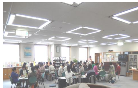
和やかな雰囲気の中活発な交流をされる参加者の方々

昨年度、さんかくカレッジを実施した3つのグループから、報告をしていただき、事務局から今年度の“さんかくカレッジ”と“はもりあフェスタ”の企画募集等についての説明をしました。その後、5つのテーブルに分かれ、グループ紹介や男女共同参画の推進に関する意見交換などをしていただきました。話が盛り上がり、終了時間を過ぎて話し合いを続けているテーブルもあり、参加されたグループの方々にとって、有意義な情報交換・交流の場になれたのではないかと思います。