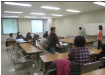
《お片づけ教室の様子》

NPO 幸せな家庭環境をつくる会は、住まい・家族・経済・ライフスタイルに関する4つをカテゴリとして、NPO活動を展開しているグループです。