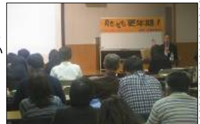
《「男も女も更年期」公開講座》

更年期を食事・運動と体の内と外から、また心の有様を、パートナーとの関係から学んだこの3回講座は、女性がもっと健康でいきいきと生活していくための気づきとなったようです。