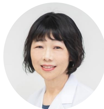
＝講師プロフィール＝

日常の産婦人科診療の中で、女性自身が自分の体や性に対して非常に無知であることに気付き、性の健康教育の必要性を痛感され、平成18年から各地で講演を始められた。