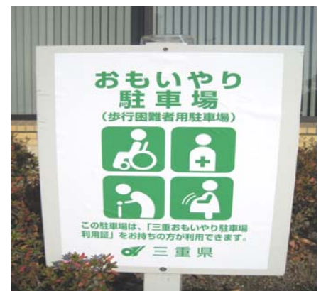
おもいやり駐車場