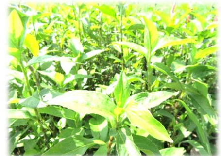
「久留倍官衙遺跡公園の藍」