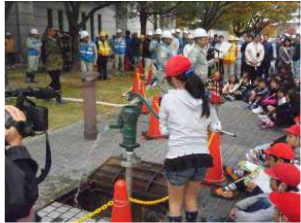
貯水槽より水道水をくみ上げ