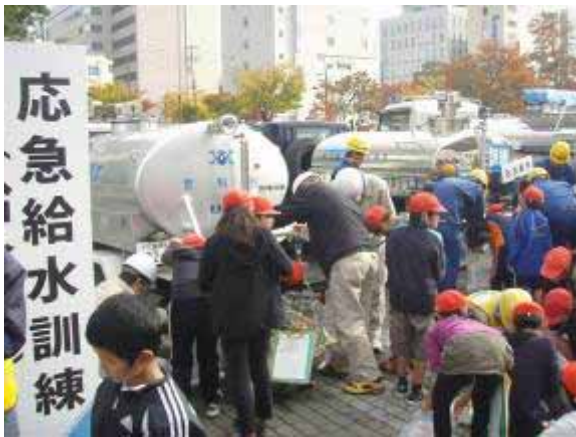
他市から参加した給水車による応急給水