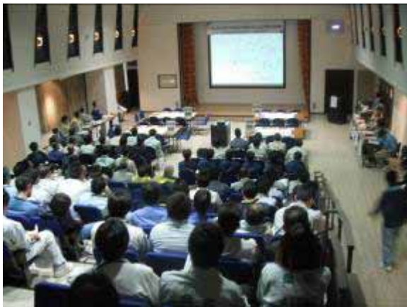
応援本部運営訓練会場