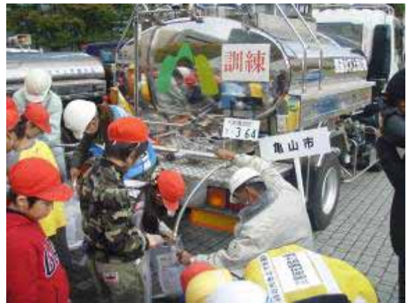
亀山市給水車による応急給水