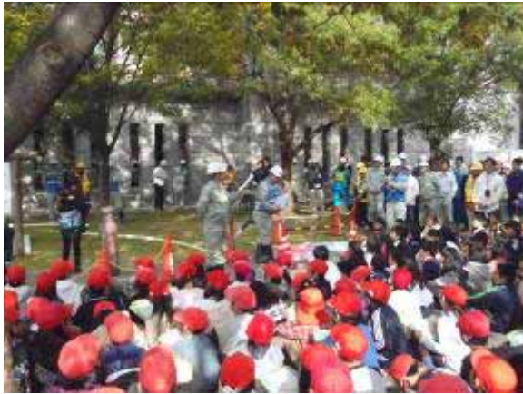
市民公園緊急用貯水槽前での応急給水説明