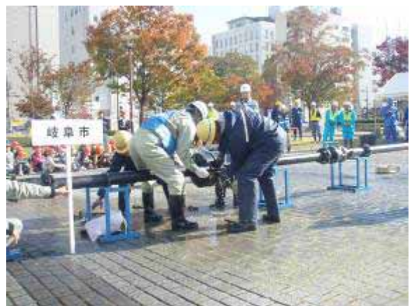
岐阜市による水道管復旧