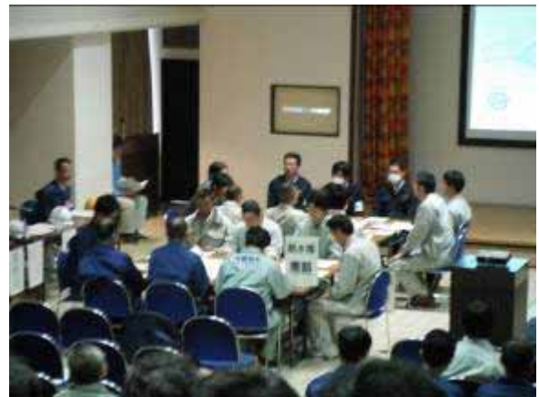
応急給水図上訓練