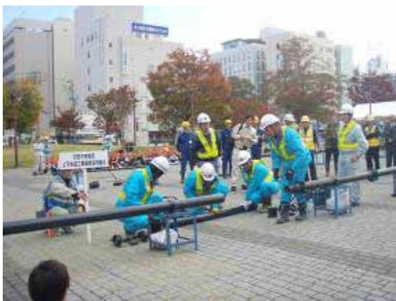
上下水道工事業者協同組合による水道管復旧