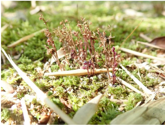
Fig. 9 枯れ始めたホンゴウソウ (東山植物園)

地上茎は大変細く、見つけにくいので、花が咲き始める7月初旬から10月初旬が適当と思われる。令和5年(2023)は気温が高く、東山植物園では例年より早く花をつけ始めたとの情報から、6月下旬から搜索を開始した。9月下旬になるとホンゴウソウは枯れ始め、色も褐色になってますます見つけにくくなる(Fig.9)ので、雄花と雌花、果実が色鮮やかな紫紅色を呈する盛夏期が良いであろう。