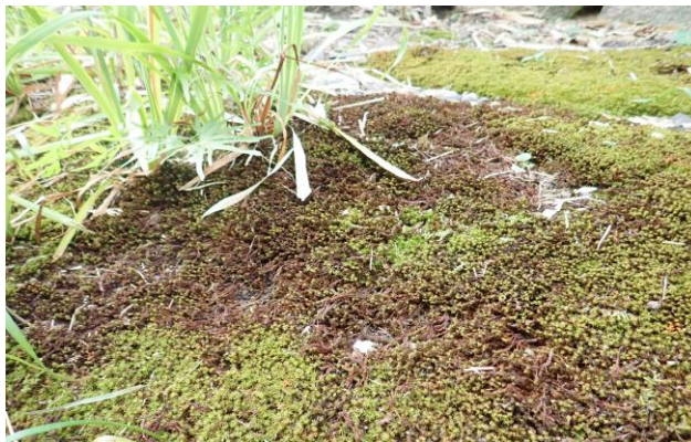
Fig. 7 来教寺境内

善光寺式阿弥陀三尊を本尊とする真宗高田派の寺で、室町時代前期の建立といわれ、永正3年（1506年）までは天台宗だったが、安政の大地震で崩壊し、明治時代に修理された。さらに昭和12年（1937年）に本堂が再建され、阿弥陀如来立像のほかに廃寺となった泰応寺・華台寺の本尊も安置されている。敷地の周囲は雑木で囲まれ、建物との間は低い下草やコケ類に覆われているが、直射日光が差し込むスペースも少なくないため、搜索範囲を限らざるを得ない。（Fig.7）