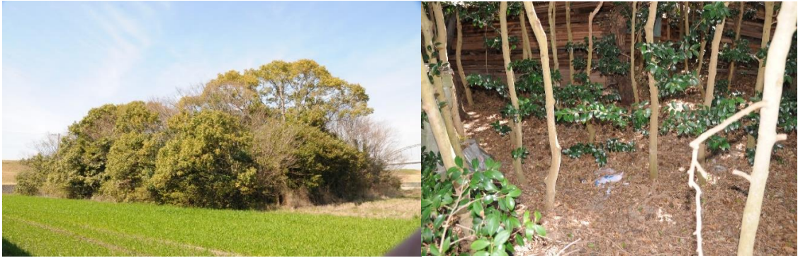
Fig. 8 正覚寺裏手雑木林