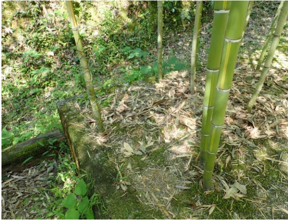
Fig. 5 東山植物園の自生地