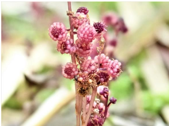
Fig.1 ホンゴウソウの花（東山植物園）

3個。下部の花は雌花で直径約1.5 mm、花被は6裂する。心皮は多数あって離生し、球状に集まっている。花柱は各心皮の腹面の上部につき、糸状で長さ約0.7 mm、多数の柱頭を突き出す。果実は径約2 mmの球形の集合果となる。1果実に1種子があり、種子はだ円形で長さ約0.3 mm。花期は7-10月で、わが国では本州（関東以西）から四国・九州、沖縄に分布することが知られ、三重県内では最近、紀宝町で発見の報告がある。ホンゴウソウは長らく日本特産種とされてきたが、2003年にフィリピンなど東南アジアにも分布する S.nana と同種であることが明らかにされ、学名が S.japonica から変更された。