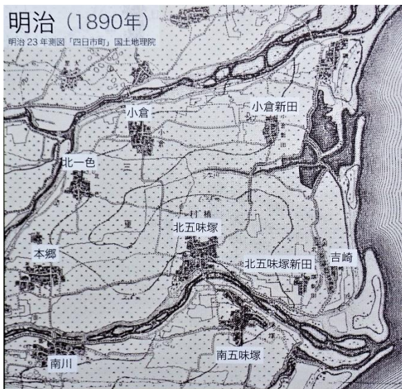
Fig.4 明治 23 年 (1890) の古地図 (楠それどこ?MAP 楠地区社会福祉協議会 HP より)