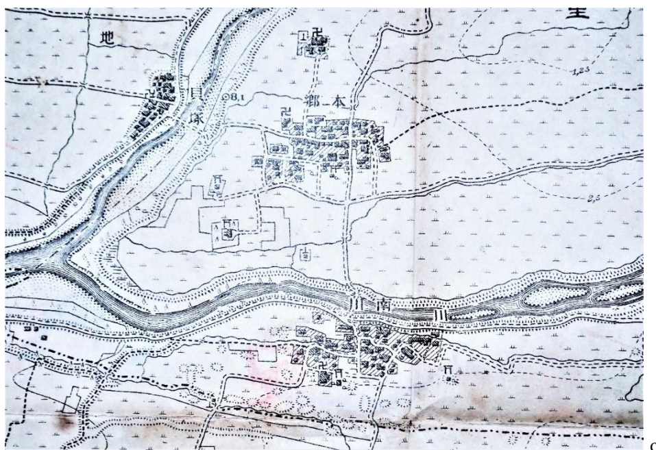
Fig.10 本郷地区の古地図（明治23年測図・「四日市町」館蔵）