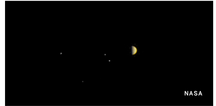
ジュノーが2016年6月21日にとらえた木星と四つの衛星の写真