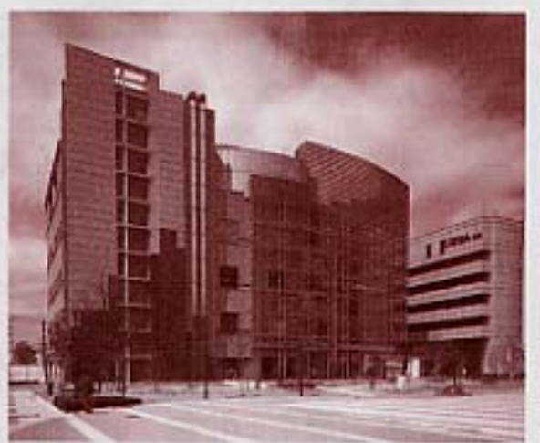
■四日市市立博物館