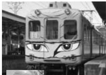
電車も忍者のようにスピーディ?

電車で揺られておよそ30分。近鉄上野市駅に到着。駅横の観光案内所で、マップなどをゲットして、いざ出発。踏切を渡って数分歩いてゆくと、そこには、お堀あり、石垣ありの、立派なお城の雰囲気があった。砂利道や不規則な幅の階段をゆったりすすむ。やさしい木漏れ日に包まれて、上野城公園の散歩を楽しんでいると、忍者屋敷が目の前に見えてきた。