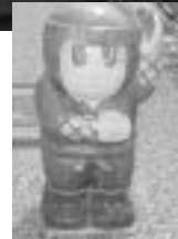
ぼく二等身の石人形