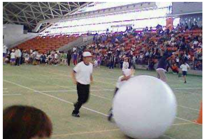
<平成20年度 三泗特別支援学級連合運動会>