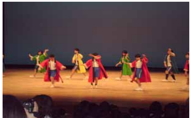
<平成19年度 三河特別支援学級学習発表会>