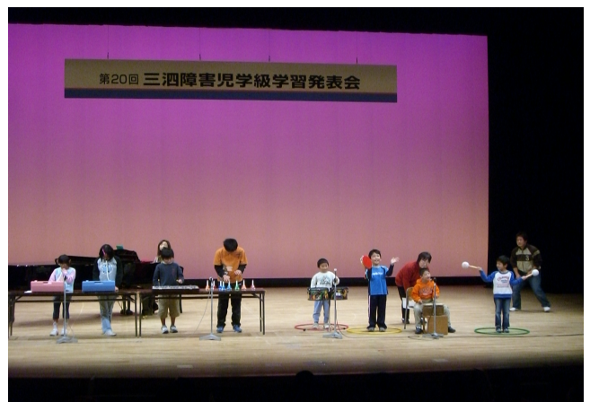
<平成18年度 三泗障害児学級学習発表会>