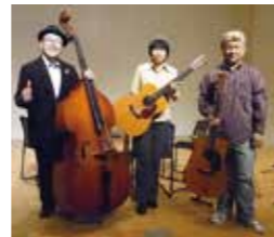
レイ&ユニオンヴァンリーズ