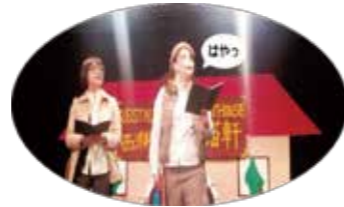
演劇集団Cブレンド