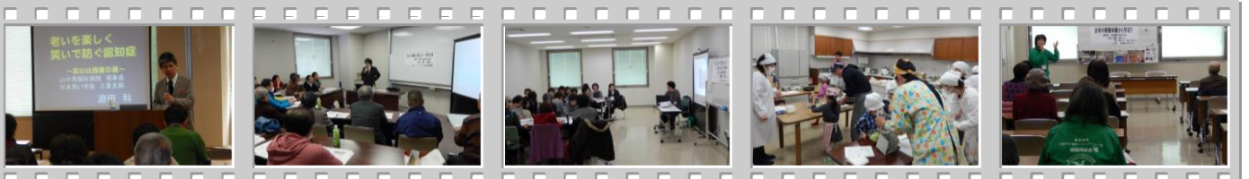
【老いを楽しく笑いで防ぐ認知症】 【「息子の介護者」が話し合う…学習と交流】 【「すこしお」ってなあ〜に?】 【パパにも作れる塩麴】 【会員の傾聴体験から学ぼう】