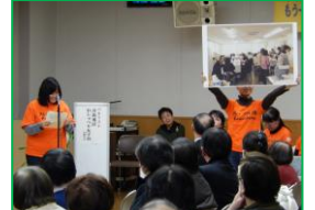
【パネリストの実践報告】