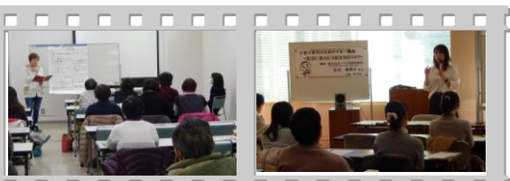
【防災・減災女性セミナー】 【子育て世代のためのマネー講座】