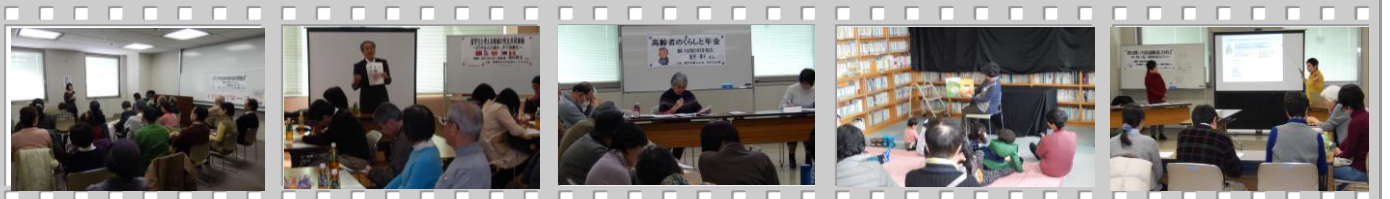
【シニアのためのほのほの朗読会】 【留学生と考える地域の男女共同参画】 【高齢者のくらしと年金】 【子どもと絵本のひろば】 【男性も家事シェア出来る高齢期の暮らし方を考える】