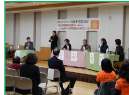
【活発なパネルディスカッション】