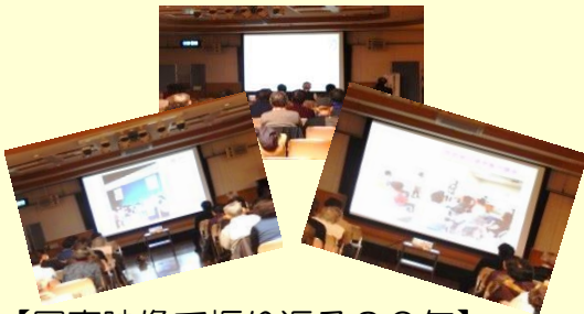
【写真映像で振り返る20年】

みえ医療福祉生協四日市まんなか支部 四日市マジック愛好会楽・楽(ララ) 女声合唱Luce(ルーチェ)