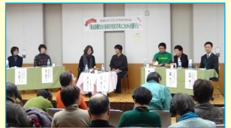
【パネルディスカッション】