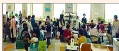
【大盛況のランチコーナー】

三重茶農業協同組合、お茶ぱん屋「しおり」、三重県立四日市農芸高校の皆さんにも、出店いただきました。