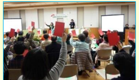
【会場が盛り上がった対談】

後半は、登録グループから5人のみなさんにパネリストとして参加いただき、それぞれの立場から「はもりあ四日市」や「男女共同参画」についてパネルディスカッションをしていただきました。会場の参加者からは、「はもりあ四日市の歴史を知ることができた」「20周年を振り返る素晴らしい企画だった」との感想をいただきました。