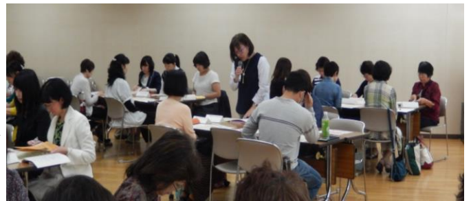
【さんかくカレッジ(市民企画)の発表をするグループ】

つどいの後半では各グループの情報交換会を行いました。普段なかなか顔を合わす機会のないグループですが、お互いの活動や情報について意見交換をして時間いっぱいまで話に花を咲かせていました。