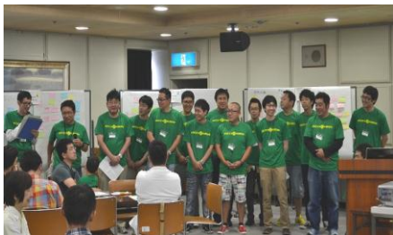
〈第9分科会での パパスマイル四日市の皆さん〉

四日市市主催の父親の子育てマイスター(現在第5期生募集中)修了生の1期生から4期生の有志によって結成された“パパスマイル四日市”と四日市市が協力して、第9分科会を実施しました。