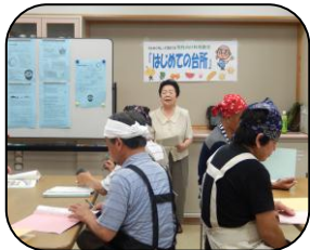
ちょこっとさんかく教室

これから3カ月の間、『みなさん！いっぱい料理してくださいね。料理って楽しいですよ(=^・^=)』