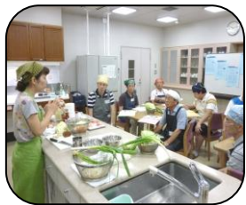
説明を聞く受講者