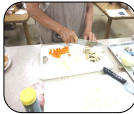
包丁さばき！お見事！