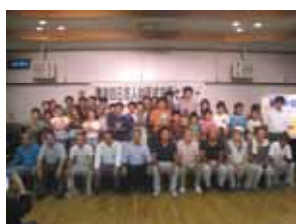
<完成品を持った子どもたちと大工さんで記念撮影>