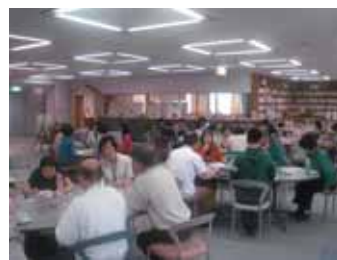
<登録グループのつどいの様子>

5月11日(土)、29グループから34名が参加し、コーヒーや紅茶を飲みながら和やかな雰囲気の中で登録グループのつどいを開催しました。5つのグループから、昨年のさんかくカレッジの報告や今年度の“さんかくカレッジ”と“はもりあフェスタ”の企画募集等についての説明の後、5つのテーブルに分かれ、グループ紹介や自分たちが男女共同参画を推進していくのに何ができるのかなど、様々なことを話し合っていました。その後の発表では、「グループが企画し開催する講座への参加者数増加の手法」「一人ひとりを元気付ける活動ができればよい」「他のグループと連携して何かに取り組むことができるのではないかなど非常に積極的な意見も出て、第1回登録グループのつどいは参加された皆さまにとって有意義な交流の場になったと思います。