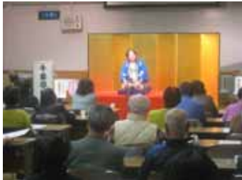
千金亭値千金さんによる 創作落語

町内会の防災委員を決める会合で、男ばかりだった防災委員を、これからは“女3人、男3人にする”という決まりを作った。ところが、なりたいのは男ばかり6人。3人の男は、男だからという理由で防災委員になれない。