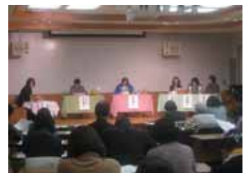
女性自治会長さんをお交えての ワークショップ

中には“女性には無理”との声もありましたが、自治会長経験のある女性からは、「家では夫の協力を得ながら自治会長を楽しくやっている」「女性にもできる」と力強い声もいただきました。 男女が共に参画していくために、組織が女性を受け入れる体制と、女性が“頼まれたら受ける”勇気と覚悟を持つことが必要 だと再認識しました。