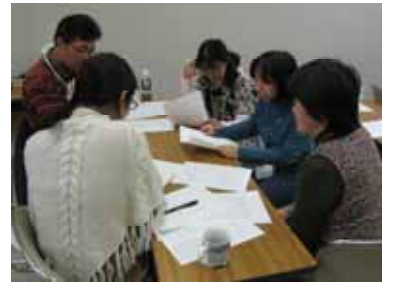
<第1回の講座の様子>

コミュ・ラボは、登録1年目の出来たてほやほやのグループです。共創力とは他者から刺激を受けながら、自分の良さを引き出し、新たな力を生み出すこと。11月26日に開催された第1回では、課題をそれぞれ読んで、それぞれの解釈についてグループで話し合いをするなど、講義形式ではなく体験学習で学びました。組織、チームに関心をお持ちの方はもちろん、日常での人間関係やコミュニケーションに興味・関心をお持ちの方にも、ぜひお勧め致します。第2回は12月24日、第3回は1月14日、いずれも13時からです。各回500円で、1回だけでも参加できます。