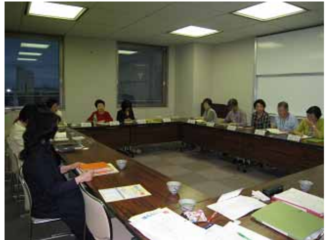
<第1回企画運営委員会の様子>