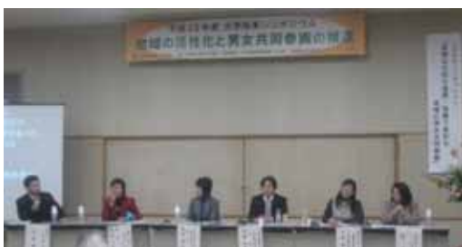
＜パネルディスカッションの様子＞

こういった機会を通じ、多種多様な人材がお互いに学びあい、つながっていくことが、男女共同参画社会の実現に近づく一歩だと実感しました。