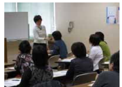
＜遠矢先生の講演会の様子＞

「男は強く、女をリードする」「女は優しく、男を立てる」のように、育ちの中で刷り込まれた性のことを「ジェンダー」といいます。このジェンダーの考えに基づく性別役割分担意識により、加害性・被害性がつくられ、DVがおこることがあります。子どもたちを被害者にも加害者にもしないためには、このジェンダーの視点を学ぶとともに、「安心」「信頼」「尊重」の関係と「支配」「管理」「所有」の関係の違いを見極める力を育むことが必要です。