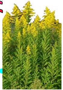
セイタカアワダチソウ